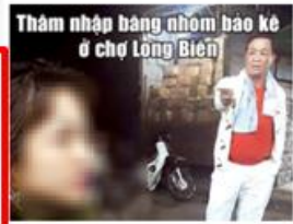
Thâm nhập bang nhóm bao kê ở chợ Long Biên