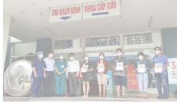
Thêm 5 bệnh nhân COVID-19 ở Đà Nẵng đã khỏi bệnh, xuất viện