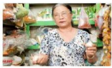
Hướng dẫn phân biệt tỏi hàng Việt Nam và Trung Quốc