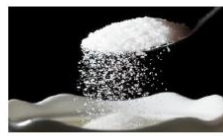
7 dấu hiệu cho thấy cơ thể dư đường