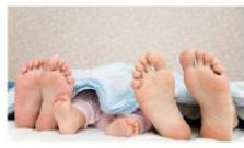
Ly hôn vẫn... chung giường