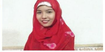
Chữ duyên và lòng nhiệt thành người trẻ