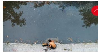
Người đàn ông lặng lẽ dọn rác sau cơn mưa