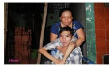
Bài 5: Mẹ là đôi chân của con